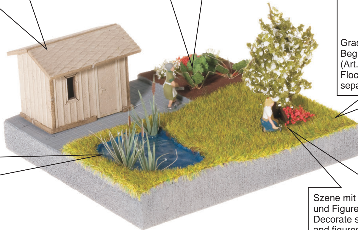
Szene mit Gras-Büschelein, Baum und Figuren ausgestalten. Decorate scene with grass tufts, tree and figures.