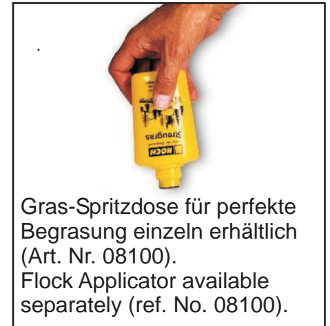
Gras-Spritzdose für perfekte Begrasung einzeln erhältlich (Art. Nr. 08100). Flock Applicator available separately (ref. No. 08100).