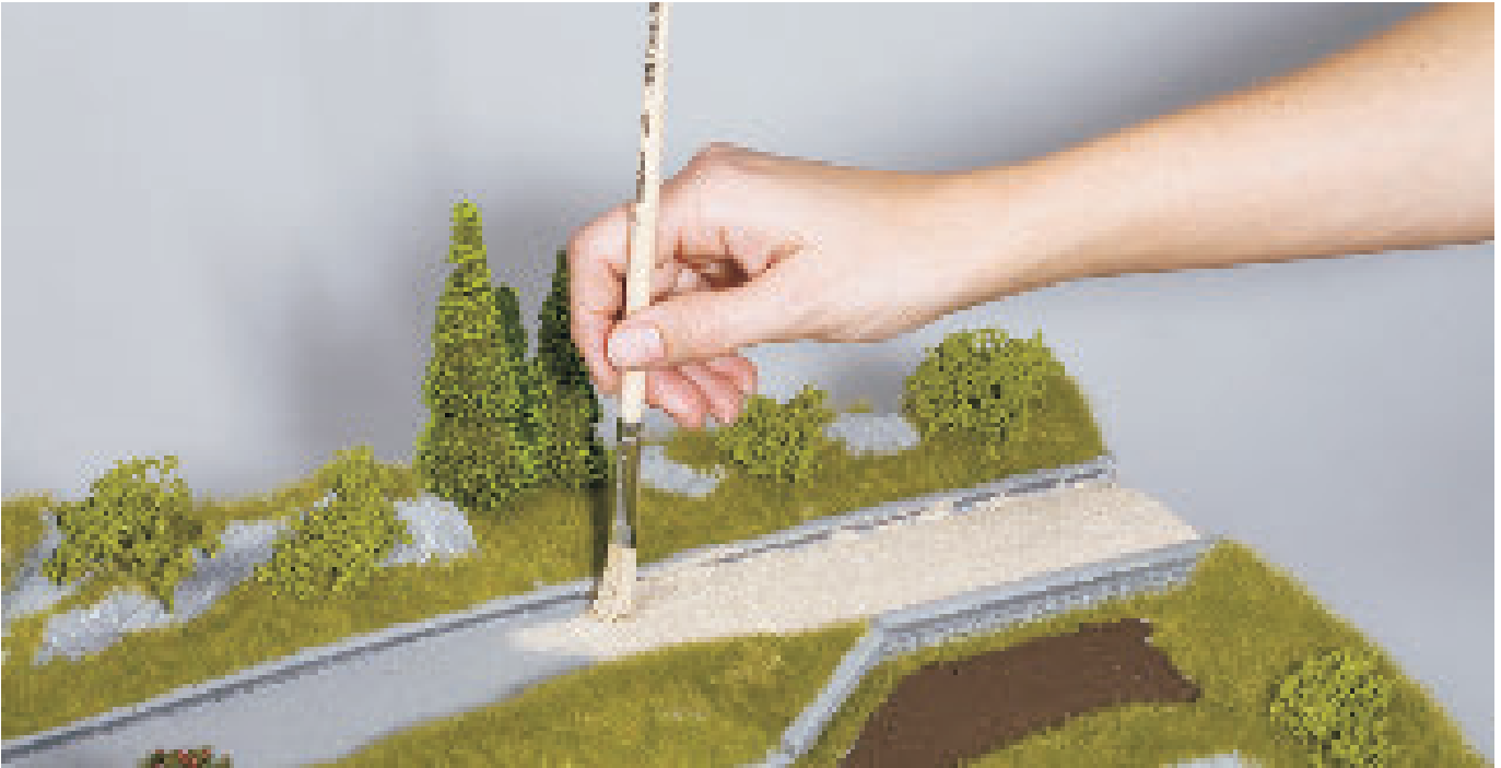
Boden-Strukturpaste einfach aufbringen. Terrain structure paste is applied easily.