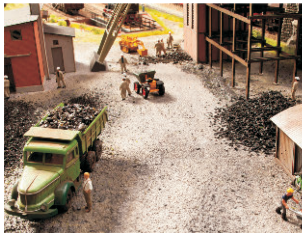
60824 Boden-Strukturpaste "Industrie & Gewerbe"