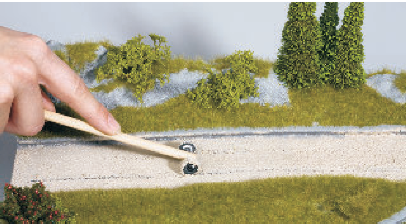
Boden-Strukturpaste nach Belieben formen. Terrain structure paste is mouldable.